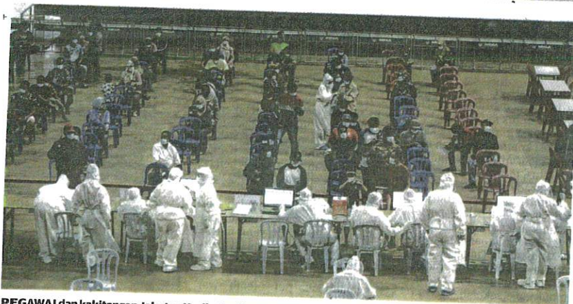
PEGAWAI dan kakitangan Jabatan Kesihatan Negeri Selangor melaungkan azam untuk terus berusaha memerangi pandemik Covid-19 walaupun perlu bertugas tujuh hari seminggu.

Daripada jumlah itu, 18 adalah kluster tempat kerja, 15 kluster komuniti, dua kluster pusat tahanan dan satu kluster kumpulan berisiko tinggi.