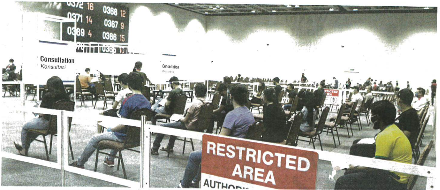
ORANG ramai menunggu untuk mendapatkan suntikan vaksin secara walk-in di Pusat Pemberian Vaksin (PPV) Pusat Konvensyen Kuala Lumpur (KLCC), semalam.

Oleh Shaiful Shahrin Ahmad Pauzi am@hmetro.com.my