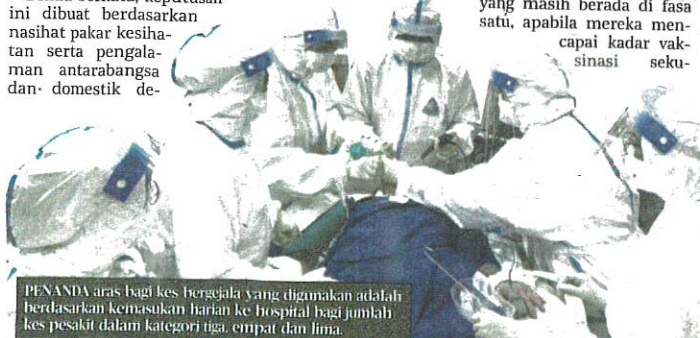
PENANDA aras bagi kes bergejala yang digunakan adalah berdasarkan kemasukan harian ke hospital bagi jumlah kes pesakit dalam kategori tiga, empat dan lima.

naan kapasiti wad ICU penuh semasa Jun namun setelah kadar vaksinasi mencecah 50 peratus pada Julai, penggunaan kapasiti wad ICU menurun dan mencapai tahap mencukupi," katanya.