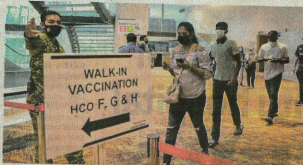
Penduduk sekitar Lembah Klang beratur bagi menerima suntikan vaksin secara 'walk-in' di Pusat Pemberian Vaksin (PPV) Pusat Konvensyen Kuala Lumpur pada Ahad.

63 kes, Perlis (enam) dan dua di Labuan," katanya.